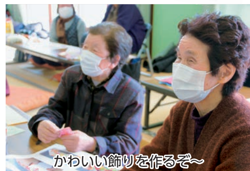
かわいい飾りを作るぞ〜

折り紙は少し難しいと感じる方も多かったようで、手順の説明書とじ〜つとにらめっこをして手が止まってしまう方もいましたが、参加者同士教え合いながら、なんとか男雛女雛を折り上げていました。