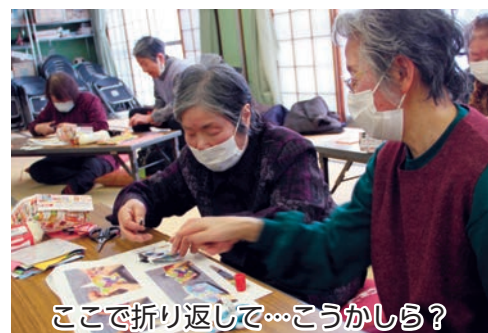
ここで折り返して…こうかしら？