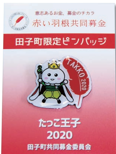
今年度のピンバッジ

1回500円で回すことができ、代金は赤い羽根共同募金へ寄付され、田子町の福祉活動の推進に役立てられます。ガーリックセンターへお越しの際には是非チャレンジしてみてくださいね！ただし500円硬貨は使用できませんので、両替がないよう100円硬貨5枚のご用意をお願いします。