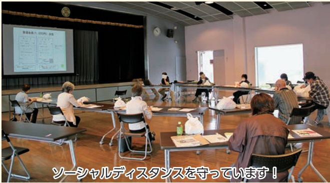
ソーシャルディスタンスを守っています！

7月15日と16日に、福祉協力員研修会を「三密」を避けるため、3つの地域に分けて開催しました。例年はほのぼの協力員との合同研修会を開催していましたが、新型コロナウイルス感染症予防の観点から、今年度はほのぼの協力員の皆さまには資料のみとなりました。