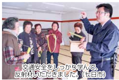
交通安全をしっかり学んで、 反射材いただきました。（七日市）

社会福祉協議会では、地域の住民同士の自発的な支え合い活動の一つである「ふれあい・いきいきサロン」を各地域に勧めています。定期的に外出する機会をつくり、人と会話して笑うことで認知症や引きこもりの予防、隣近所のつながりを深めることができます。社協会費の一部をサロン活動に助成（1人300円）しておりますので、お気軽に田子町社会福祉協議会までお問い合わせください。（☎32-4045）