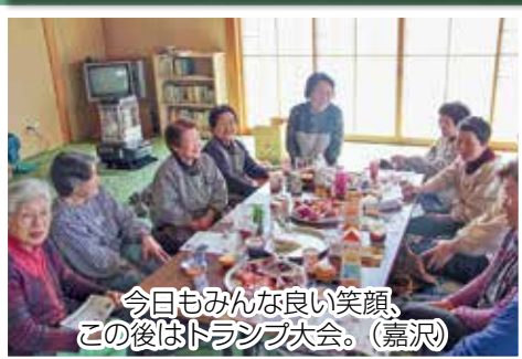
今日もみんな良い笑顔、この後はトランプ大会。(嘉沢)