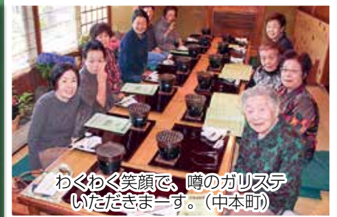
わくわく笑顔で、噂のガリステ いただきます。（中本町）