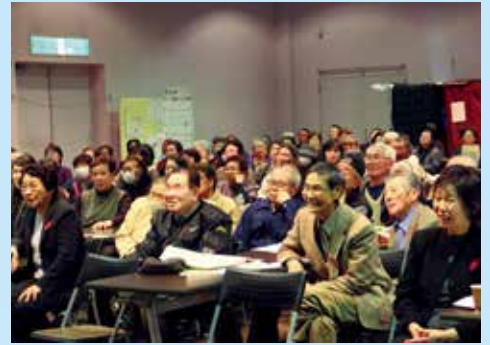
観客も一座の劇に目が釘付け