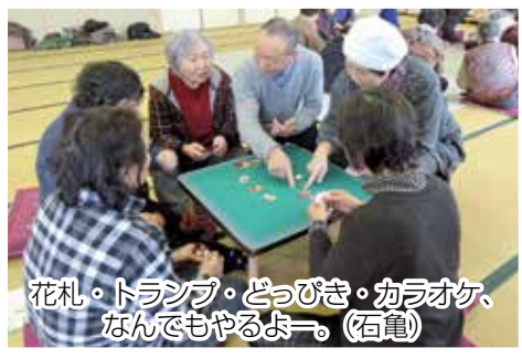
花札・トランプ・どっぴき・カラオケ、なんでもやるよ。(石巻)