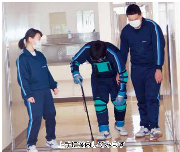
上手に案内してみます

全員の体験が終了した後、イメージした高齢者になれそうと感じたかと聞くと、多くの生徒がなれないと感じたようでした。なぜなれないと思ったのか、何が出来れば、何があればなれるのか。生徒たちは今回の体験を通し多くの事を考える機会となったようでした。