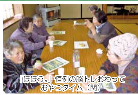
「ほほう。」恒例の脳トレおわって おやつタイム (関)