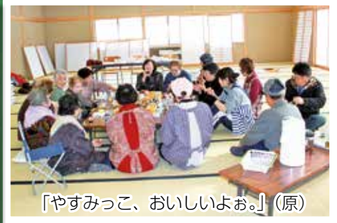
「やすみっこ、おいしいよお。」(原)