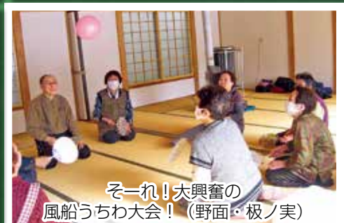
そーれ！大興奮の 風船うちわ大会！（野面・極ノ実）