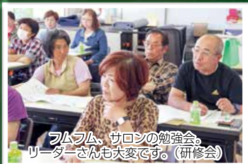
フムフム、サロンの勉強会。リーダーさんも大変です。(研修会)