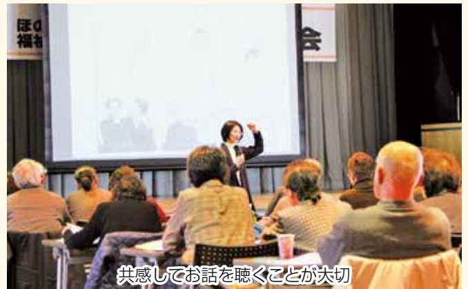
共感してお話を聴くことが大切

2月28日、中央公民館にて、平成29年度ほのぼのの協力員・福祉安心電話協力員合同研修会を開催しました。