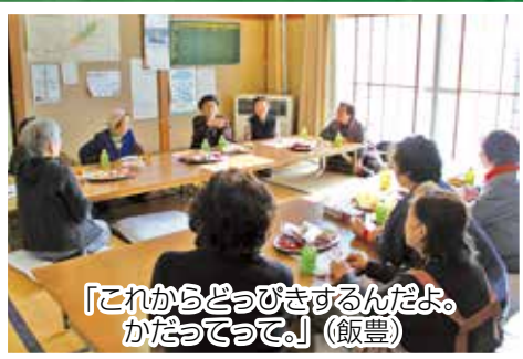
「これからどっぴきするんだよ。かだってって。」(飯豊)