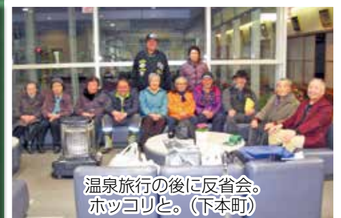
温泉旅行の後に反省会。 ホッコリと。（下本町）