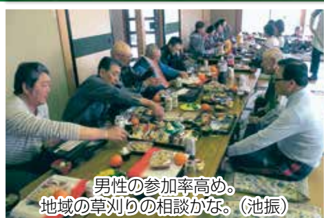
男性の参加率高め。 地域の草刈りの相談かな。（池振）