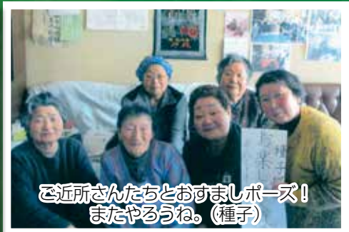
近所さんたちとおすましポーズ！ またやるうね。(種子)