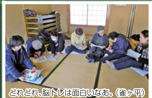
どれどれ、脳トレは面白いなあ。（雀ヶ平）