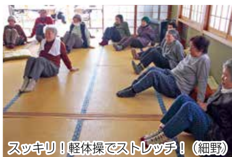
スッキリ！軽体操でストレッチ！（細野）