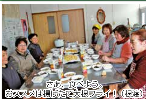
さあ、食べよう。 おススメは揚げたて大根フライ！（根渡）