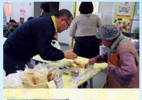
各施設からもご協力いただきました

11月14日、田子町中央公民館において第51回田子町社会福祉大会が開催され、「みんなで作る心のかようやさしい福祉のまち」をスローガンに、約150名の町民の皆様及び福祉関係者が集い、式典を行いました。式典では、社会福祉発展に功績のあった9名と2団体が表彰されました。