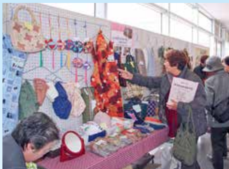
サロンからも多くの作品を出してもらいました