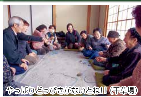
やっぱりどっぴきがないとね!! (干草場)