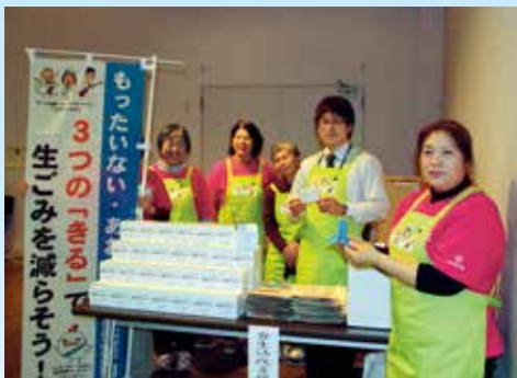
食生活改善推進員の皆さん