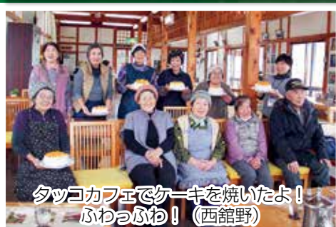
夕ツコカフェでケーキを焼いたよ！ ふわっふわ！（西館野）