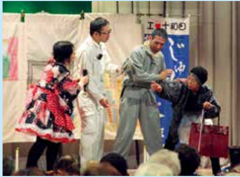
一座のみなさんが会場を盛り上げました