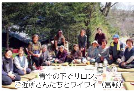
青空の下でサロン。 ご近所さんたちとワイワイ（宮野）