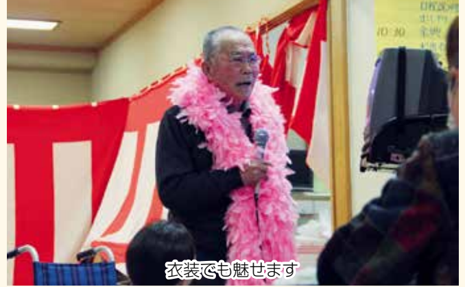
衣装でも魅せます

12月3日、せせらぎの郷ホールにて、社会福祉協議会が行っている介護保険事業の利用者やご家族、ボランティアの方など約80名が参加し、介護保険サービス利用者忘年会を開催しました。