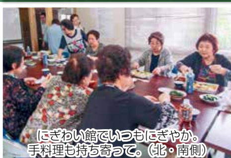
にぎわい館でいつもにぎやか。 手料理も持ち寄って。（北・南側）